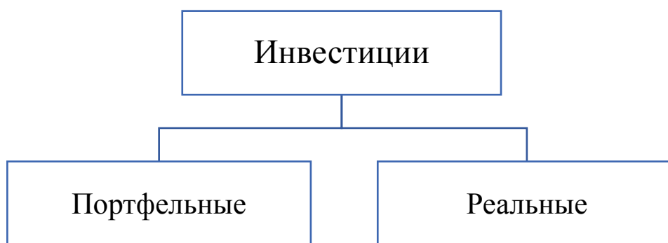
Рисунок 1 – Виды инвестиций

Инвестиции могут поступать в экономику страны двумя способами, которые представлены на рисунке 1.