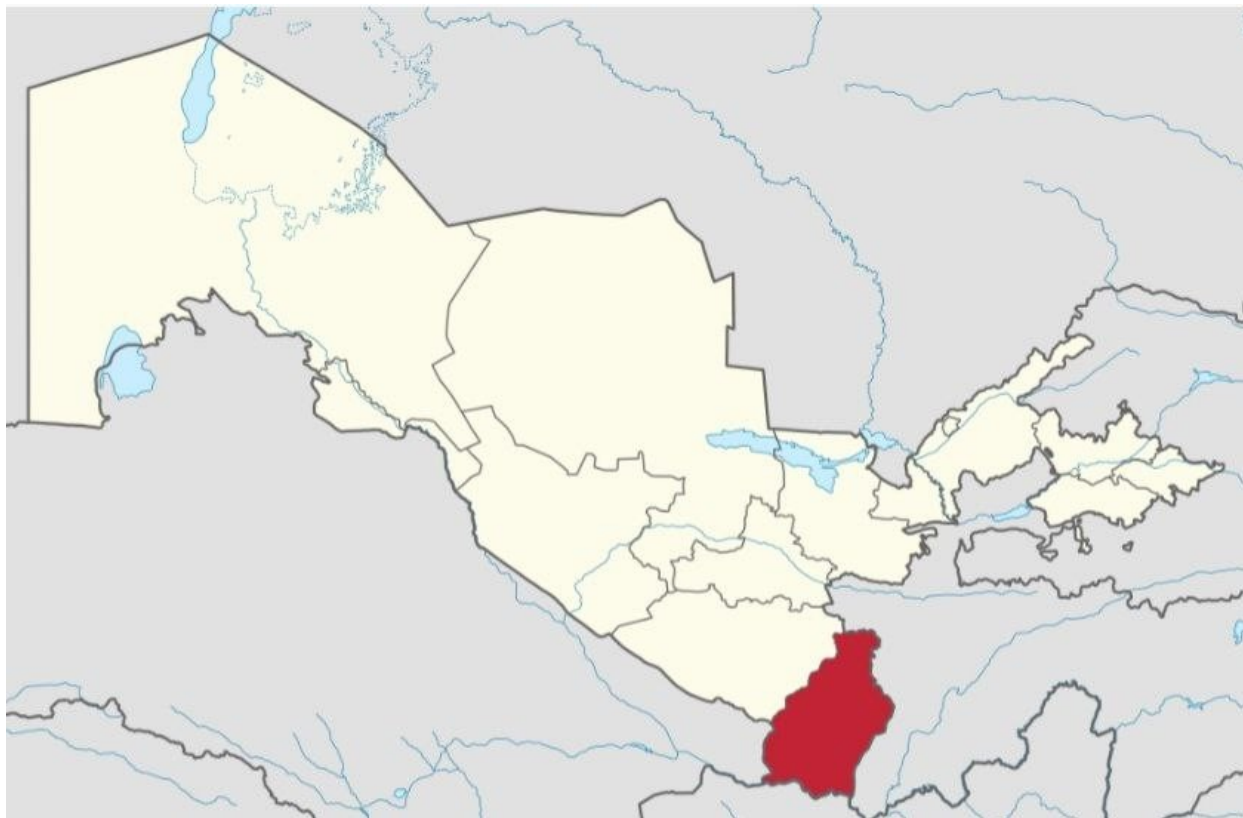
Рис. 1. Карта экономико-географического положения Сурхандарьинской области.

Сурхандарьинская область, расположенная на самом юге Узбекистана, выделяется своими традиционными жилищами, национальными костюмами и обычаями, а также древними архитектурными памятниками.