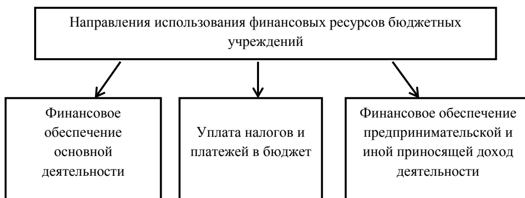
Рисунок 2 – Направления использования финансовых ресурсов бюджетных учреждений [7].

профессиональное развитие сотрудников, а также устранение чрезвычайных происшествий в виде пожаров, наводнений и т.д.).