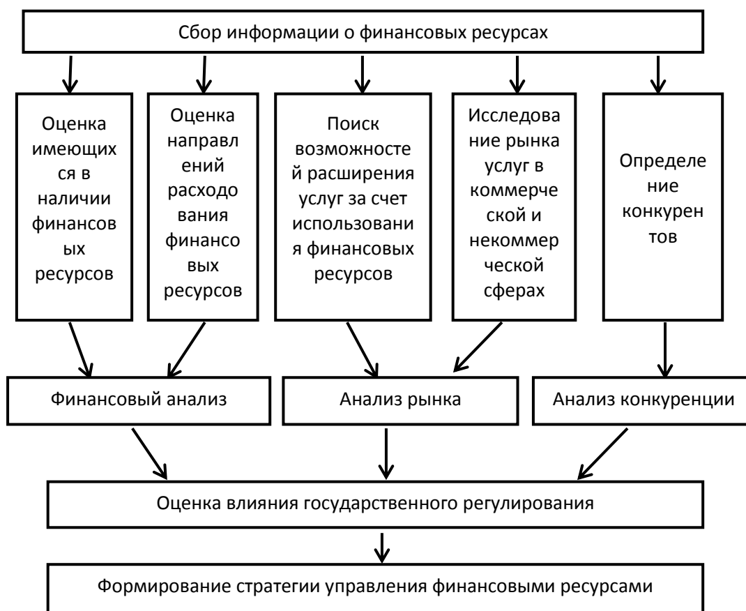
Рисунок 3 – Схема управления финансовыми ресурсами в бюджетных учреждениях [6].

Процесс управления финансовыми ресурсами бюджетных учреждений предлагается по следующей схеме: