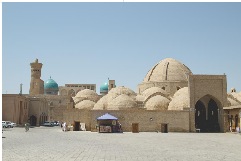
Рис. 1. Торговые купола Бухары