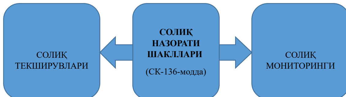
1-расм. Солиқ назорати шакллари.

Ўзбекистон Республикаси солиқ Кодексига асосан солиқ назорати шакллари ва турлари мавжуд: (1-расм)