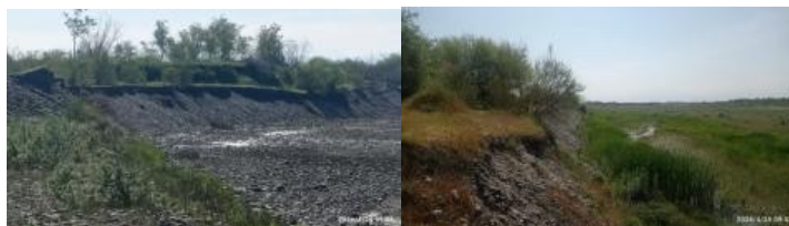
Рис. 3–4. Нынешнее русло реки Зарафшан (7–8 м).

Так называемые предприниматели разрушили реку Зарафшан, похитив миллионы кубометров песка и гравия, нанося природе, реке, национальному парку и заповеднику ущерб в миллиарды, не поддающийся восстановлению.