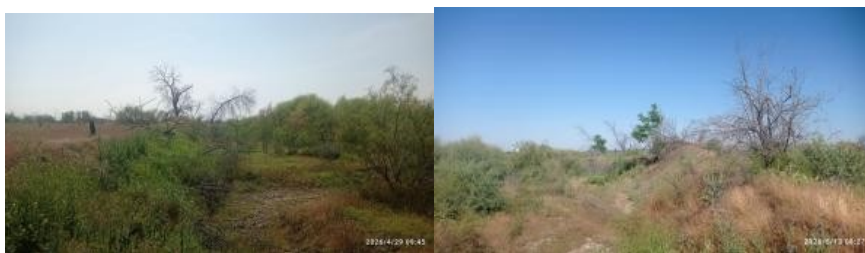
Рис. 1–2. Старое русло реки Зарафшан (3–4 м).

мониторинговых наблюдений, первая терраса (старое русло) реки опустилась на 3–4 метра, а второй уровень (нынешнее русло) — на 7–8 метров.