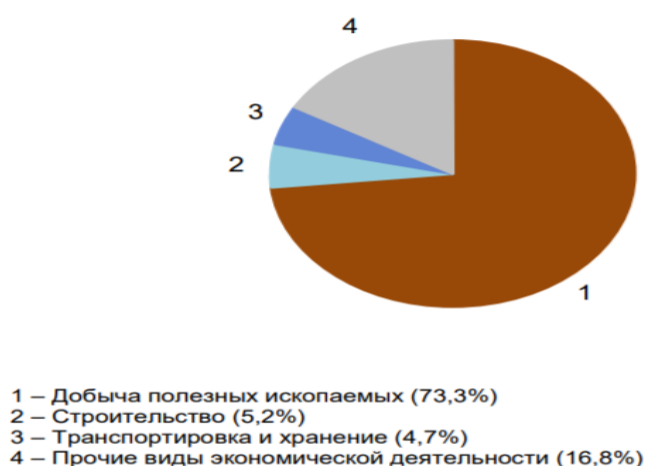
Рисунок 2 – Структура валового регионального продукта ХМАО-Югры за 2020 г. [6]

В структуре валового регионального продукта в 2020 г. основными видами экономической деятельности являлись: добыча полезных ископаемых – 73,3%; строительство – 5,2; транспортировка и хранение – 4,7 % (рисунок 2).