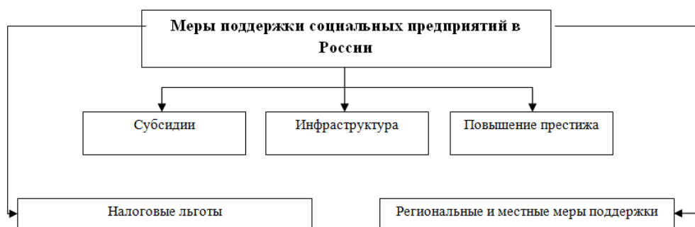
Рисунок 1 – Виды мер поддержки социальных предприятий в России

Для достижения социального благополучия на федеральном уровне, существуют следующие меры государственной поддержки социальных предприятий в Российской Федерации.