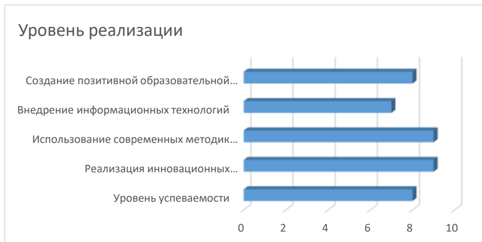
Рисунок 1 - Уровень успеваемости и реализации инновационных образовательных программ в МОАУ «СОШ №89».

образовательных программ. Школа активно использует современные методики преподавания и внедряет информационные технологии в образовательный процесс, что создает позитивную образовательную среду для учащихся.