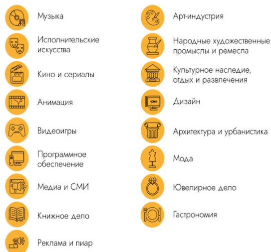
Рисунок 4. Регламентированная группировка креативного сектора