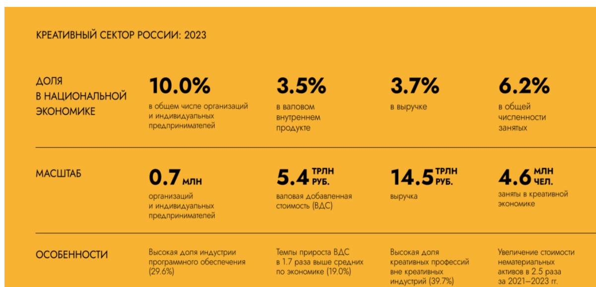
Рисунок 1. Роль в экономике России

В структуре национальной экономики, наряду с промышленным производством, агропромышленным комплексом и сферой услуг, заметную роль начинает играть креативная (творческая) индустрия. В соответствии с законодательным определением, закреплённым в Федеральном законе от 8 августа 2024 г. № 330-ФЗ «О развитии креативных (творческих) индустрий в Российской Федерации», креативная индустрия рассматривается как направление экономической деятельности, связанное с созданием, продвижением на внутреннем и внешнем рынках, распространением и/или реализацией креативного продукта, обладающего уникальными свойствами и экономической стоимостью.