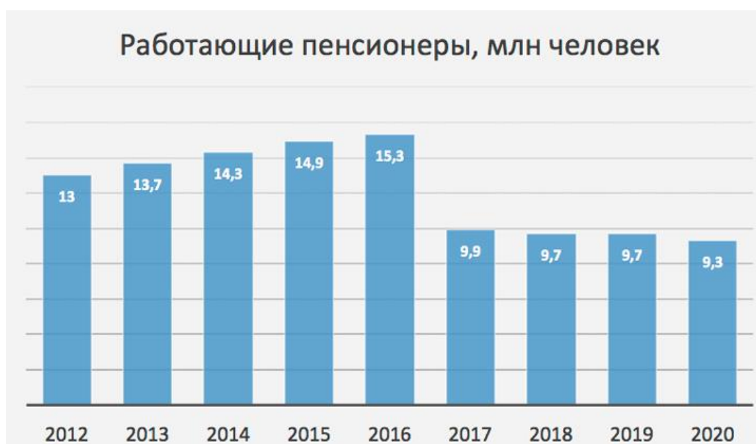
Рисунок 2 – Работающие пенсионеры, млн. человек [7]

Пенсионное обеспечение по-прежнему остается одной из главных социальных гарантий пожилых граждан, а размер пенсии — показателем состояния экономики и уровня производительности труда [5].