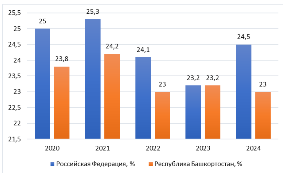
Рисунок 1. Доля граждан пожилого возраста к общей численности населения, %

Согласно Рисунку 1, в 2020 году разница между процентами в Российской Федерации и Республике Башкортостан составляла 1,2%. В 2021 году разница увеличилась до 1,1%. В 2022 году разница сократилась до 1,1%, а в 2023 году достигла 0,2%, что говорит о том, что в республике уровень пожилого населения стал ближе к общероссийскому уровню. В 2024 году Республика Башкортостан все еще будет иметь долю пожилых людей ниже общероссийского показателя, но с несущественным отставанием.