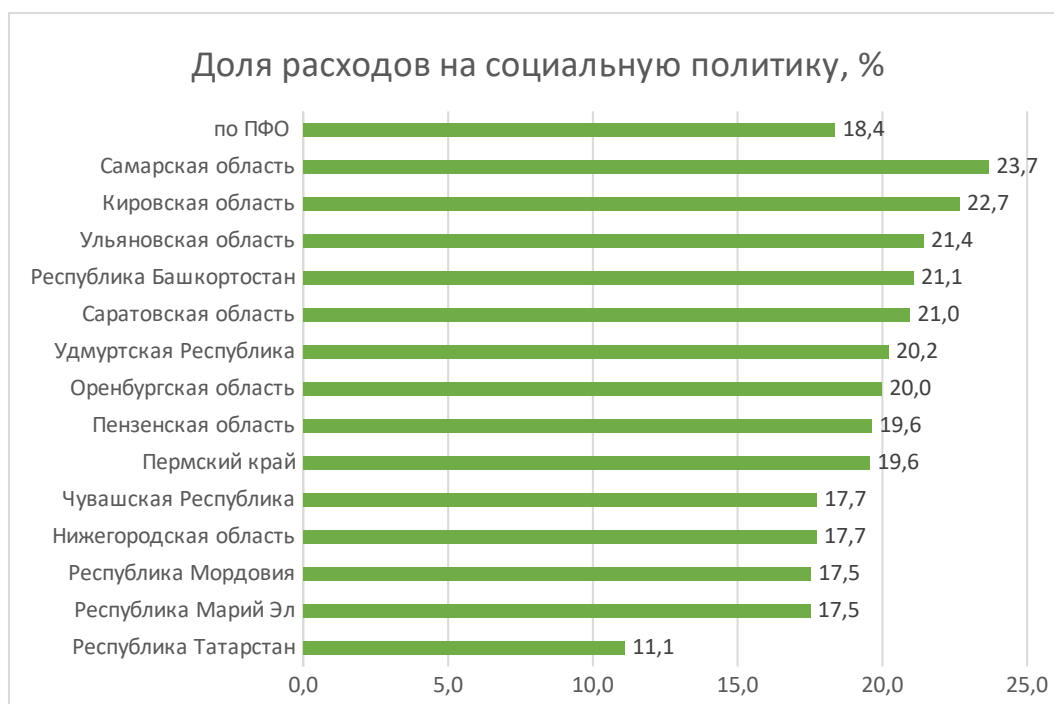
Рисунок 3 – Доля расходов на социальную политику в Республике Башкортостана и ПФО, % (составлено автором на основе )

структуре расходов, демонстрируя значительную долю инвестиций в социальные программы (см.рис.3)