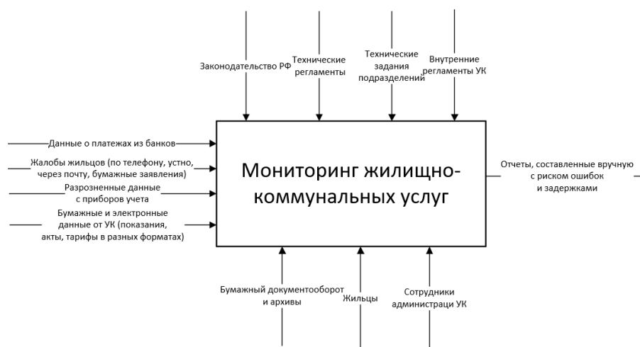
Рис. 1. Контекстная диаграмма IDEF0 «КАК ЕСТЬ»

Методы исследования: была изучена деятельность управляющей компании и выделены три категории пользователей: жилец, сотрудник УК, администратор. «Стандарт IDEF0 является наиболее распространенной методологией функционального моделирования, позволяющей структурировать описание системы и выявить взаимосвязи между ее основными процессами» [1, с. 115]. Для описания текущих и будущих процессов были построены диаграммы «КАК ЕСТЬ» и «КАК БУДЕТ» (Рис. 1.).