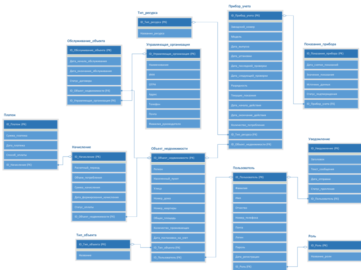
Рис. 2. Логическая модель базы данных

Результаты: была спроектирована база данных. Основные сущности: пользователи, роли, объекты недвижимости, приборы учета, показания приборов, тарифы, начисления, платежи, управляющие организации, обслуживание объектов, уведомления. Один объект недвижимости может содержать несколько приборов учета. Один прибор учета имеет много показаний (Рис. 2).