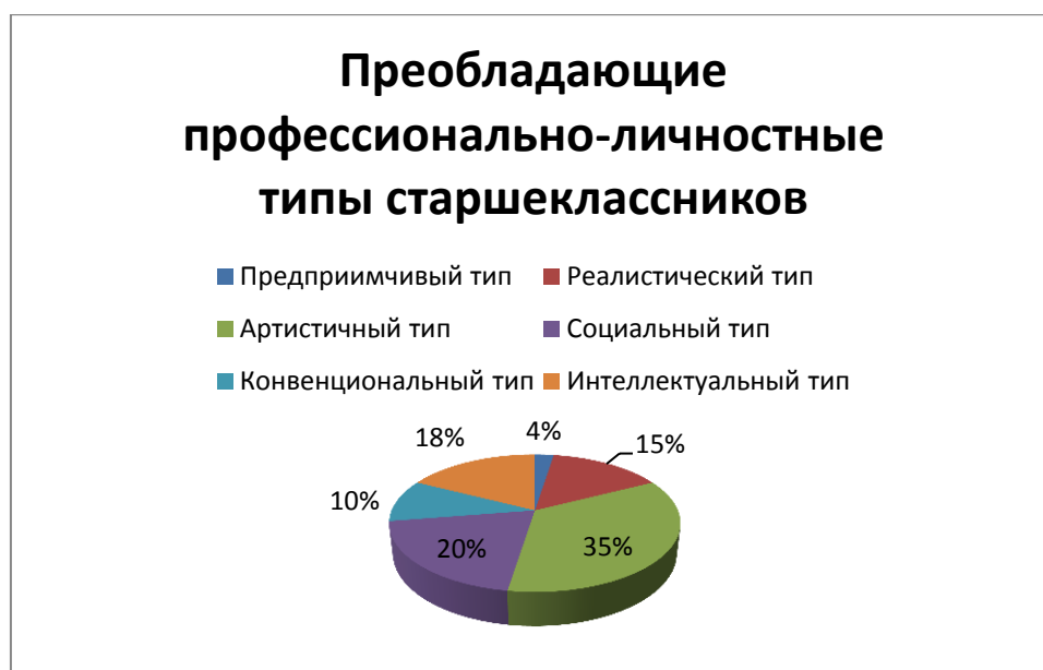
Рис.3. Показатели по методике Дж.Голланда

сфере. Однако отметим, что большинство имеет слабо выраженный интерес в сфере профессиональных интересов, что говорит о неполной осознанности школьниками своего дальнейшего профессионального пути.