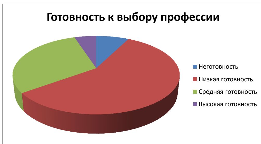
Рис.4. Показатели готовности школьников к выбору профессии

Лишь 2% респондентов – личности предприимчивого типа, что говорит о них, как импульсивных, рискованных, с ярким проявлением энтузиазма. Этому типу соответствуют профессии руководящего типа.