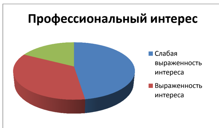
Рис.2. Степень выраженности профессионального интереса по методике «Карта интересов» А.Е.Голомштока

Исходя из данных, представленных на рис.1, мы видим, что у большинства опрошенных преобладает средний уровень выраженности того или иного типа профессий. Отчетливо выраженный тип профессии представлен в среднем лишь у 10% школьников. Полученные данные позволяют заключить, что старшеклассники не имеют четко оформленных представлений о том, какая профессиональная сфера привлекает их в большей степени.