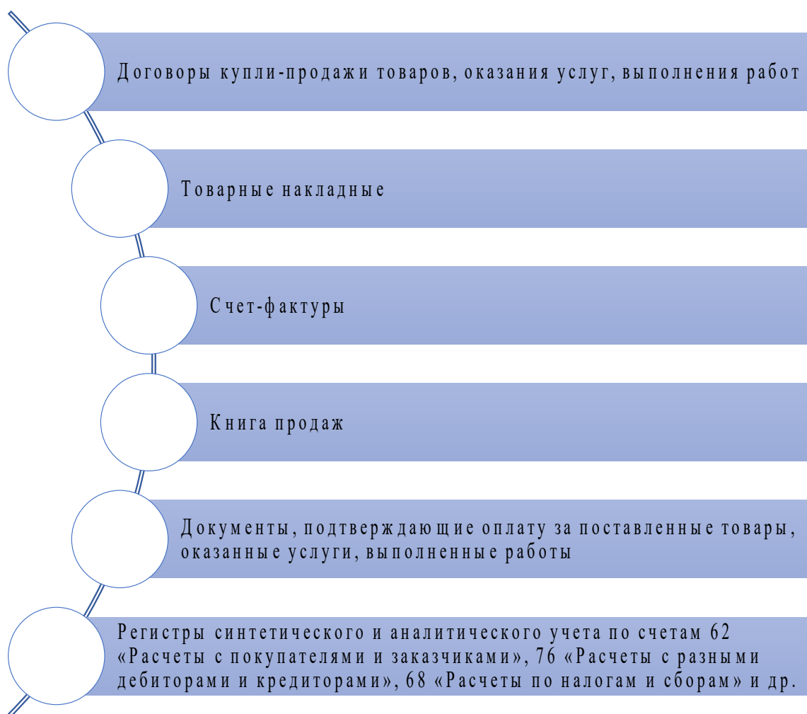
Рисунок 2 – Основные источники информации для проведения внутреннего аудита операций с покупателями и заказчиками

Внутренний аудит расчетов с покупателями и заказчиками позволяет своевременно выявить ошибки и недочеты в их учете. Именно внутренний аудит способствует своевременной разработке рекомендаций по устранению выявленных нарушений.