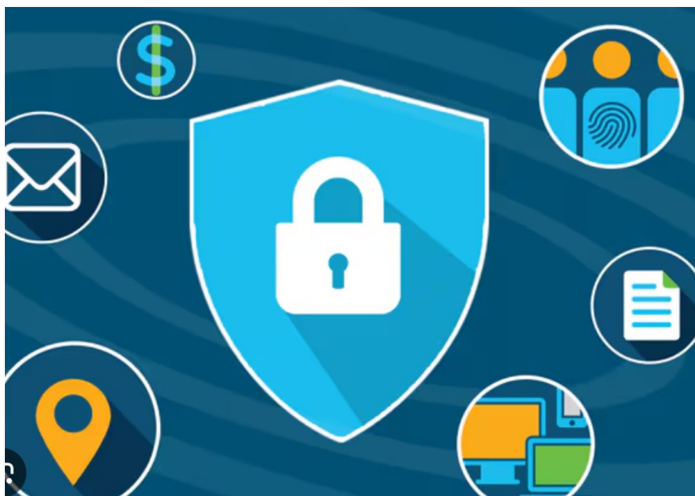
1.2-rasm. Onlayn auksionlarda xavfsizlik