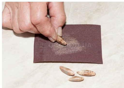
2-rasm. Skarifikatsiya usulida qattiq po‘stli urug‘larga ishlov berish

Urug‘larni radiochastotali ishlov berishda namuna ikki parallel metall plastinka orasiga joylashtiriladi, ular kuchli elektron tebranish generatorining bir qismi hisoblanadi. Namuna elektr zanjirining tarkibiy qismiga aylanib, plastinkalar (elektrodlar) orasida hosil bo‘lgan elektromagnit maydon energiyasini yutadi.