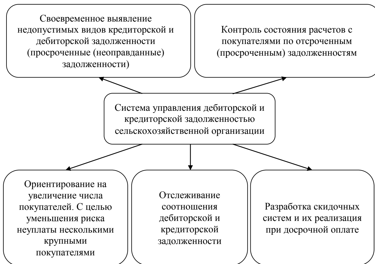
Рисунок 2 – Система управления дебиторской и кредиторской задолженностью ЗАО «Степное»