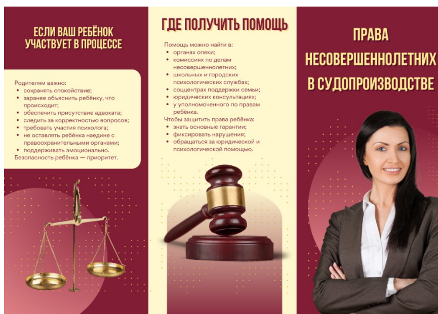
Рисунок 1 – Лицевая сторона буклета

В целом оформление буклета получило гармоничный и профессиональный вид. Он объединяет наглядность, аккуратность и структуру, создавая полноценный информационный продукт, который можно использовать как в учебной среде, так и в практической работе по повышению правовой грамотности несовершеннолетних и их родителей.