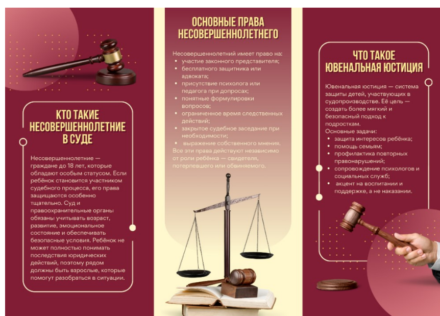
Рисунок 2 – Внутренняя сторона буклета