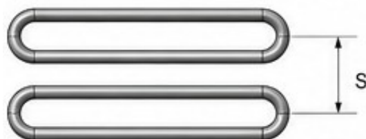
Рис 2. Оптимизированный шаг (S) змеевиков.

-Разработка рекомендаций по выбору конструктивных параметров для условий пиролизной печи.