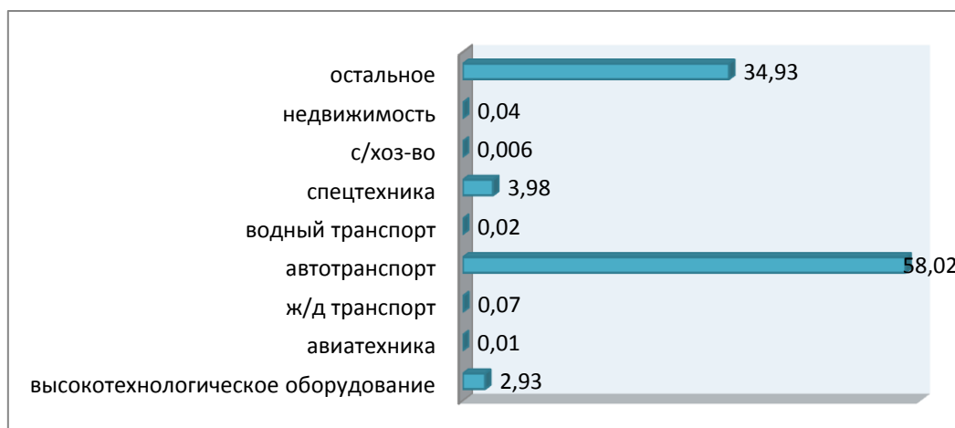
Рисунок 1 - Распределение предметов лизинга по ключевым группам оборудования в 2019 г. (%) 2

%), спецтехника (3,98 %), высокотехнологическое оборудование (2,93 %). Остальные лизинговые продукты имеет спрос меньше 1 %.