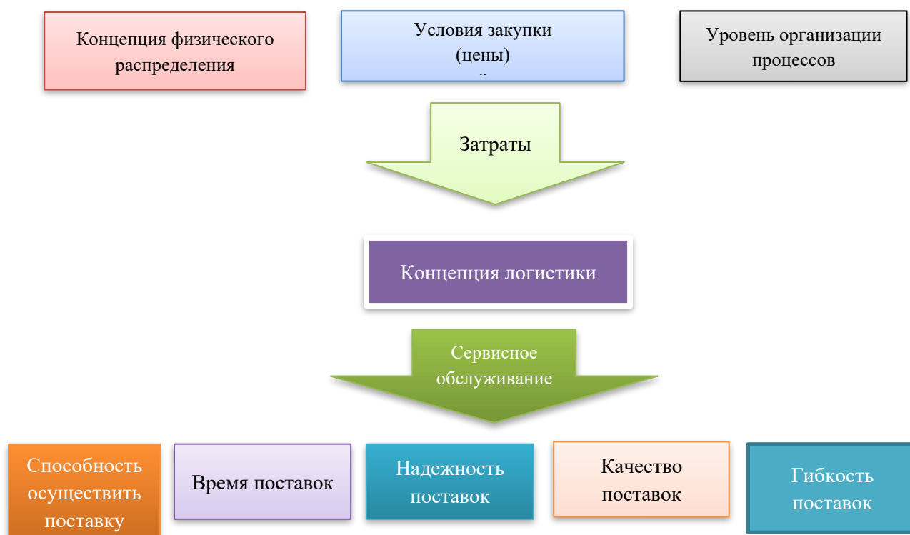
Рис.-1. Концепция логистики: вход и выход 1

Представляя схематично концепцию логистики с позиций условий её реализации результатов, т.е. входа и выхода следует выделить факторы, которые воздействуют на издержки в качестве условия реализации концепции логистики и определяют основные результаты, проявляющийся в уровне сервисного обслуживания компаний на рынке. (рис.1).