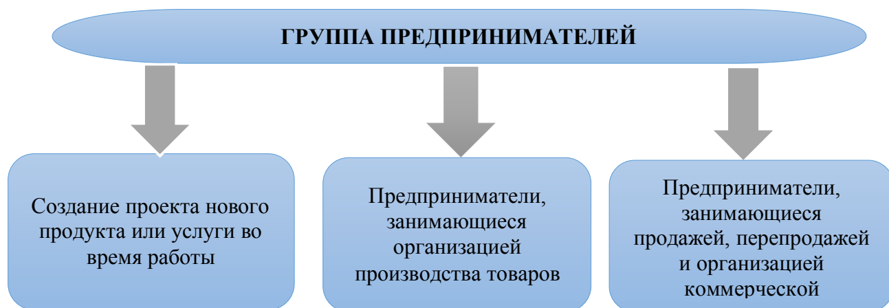
Рисунок 1.1. Три вида предпринимательской деятельности и соответственно 3 группы предпринимателей.

3) предприниматели, занимающиеся продажей, перепродажей и организацией коммерческой деятельности в период своей деятельности.